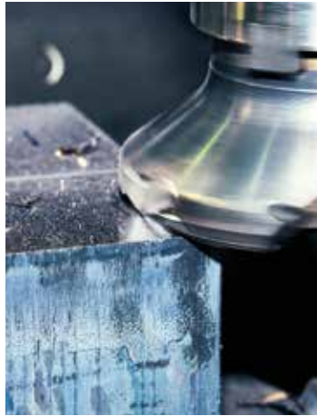
Fräsen einer planen Fläche