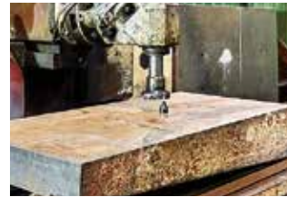
Höhenfindung für Fräsvorgang