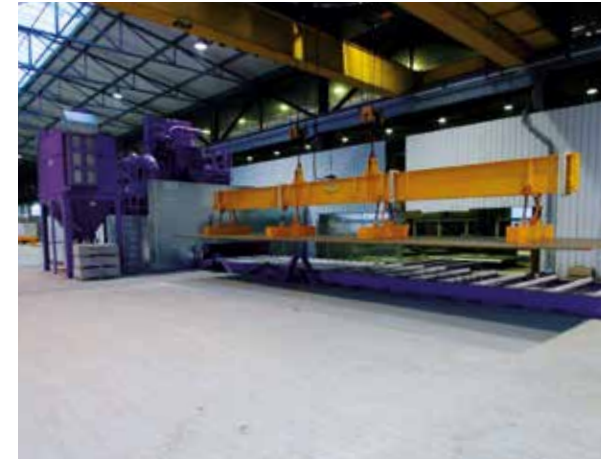
Beladung der Strahlanlage