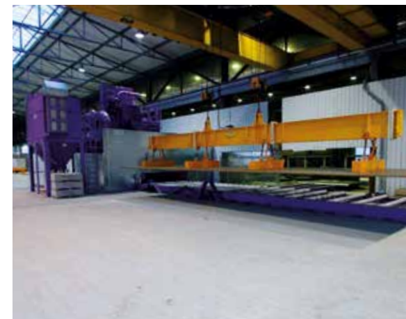
Chargement de la décapeuse par projection d'abrasif