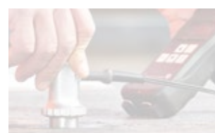
Contrôle de matériaux