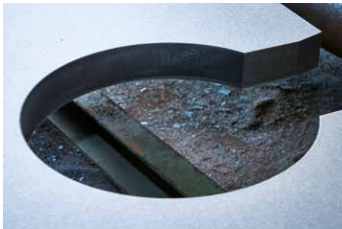
Pièce à décaper