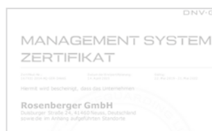
Certifications, réceptions externes