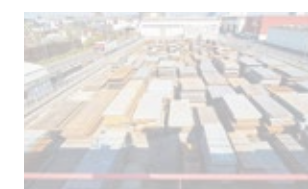
Commerce de l'acier