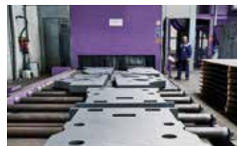
Tunnel de décapage par projection d'abrasif