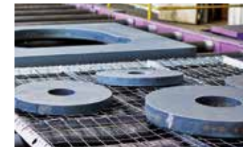
Pièces à décaper